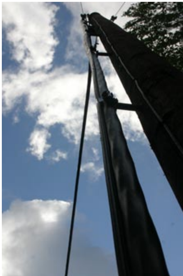
Nya tekniken med högspänd hängkabel.