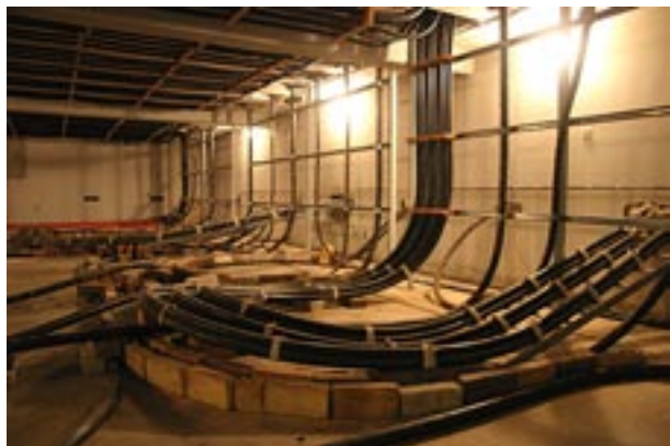
Kabelkällare i mottagningsstation.